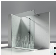
DECORACIONES NATURALES P15 ORGÁNICO