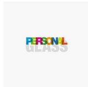
ACCESORIOS PERSONAL GLASS