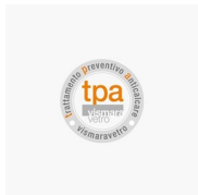
TRATAMIENTO DE PREVENCIÓN ANTICALCÁREO TRATAMIENTO PREVENTIVO ANTICALCAREO (TPA)