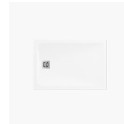
PLATO DE DUCHA V.I.P