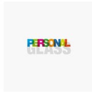
ACCESORIOS PERSONAL GLASS