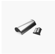
ACCESORIO LIMPIA CRISTAL VIRGOLA