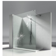
DECORACIONES NATURALES P19 SOPLO