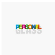
ACCESSOIRES PERSONAL GLASS