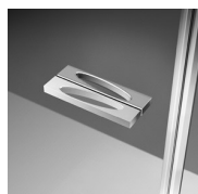
POIGNÉS M6T STANDARD