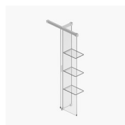
PAROI DE SÉPARATION SCREEN