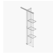
PARETE DIVISORIA SCREEN