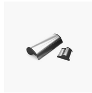
ACCESSORIO TERGIVETRO VIRGOLA