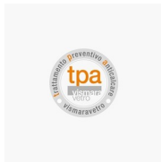
TRATTAMENTO ANTICALCARE TRATTAMENTO PREVENTIVO ANTICALCARE (TPA)