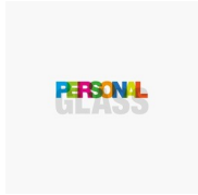
ACCESSORI PERSONAL GLASS