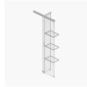
PARETE DIVISORIA SCREEN