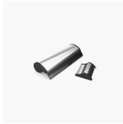
ACCESSORIO TERGIVETRO VIRGOLA