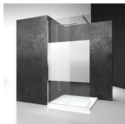
DECORI GEOMETRICI D50