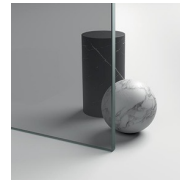
CRISTALLI TEMPERATI 07 - CRISTALLO GRIGIO