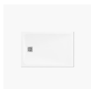
PIATTO DOCCIA VI.P