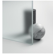
CRISTALLI TEMPERATI SPECIALI 14 - CRISTALLO EXTRA-CHIARO SATINATO