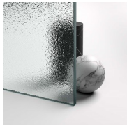
CRISTALLI TEMPERATI 01 - STAMPATO CHIARO