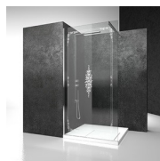
DECORI GRAFICI P56