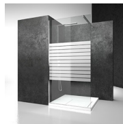
DECORI GEOMETRICI D51