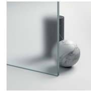
CRISTALLI TEMPERATI 08 - CRISTALLO SATINATO