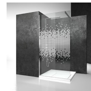
DECORI GRAFICI D54