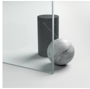
CRISTALLI TEMPERATI 12 - CRISTALLO EXTRA-CHIARO