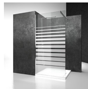
DECORI GEOMETRICI D52