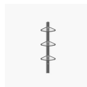
COLONNA ATTREZZATA AMICO