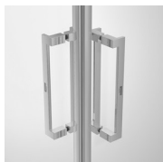
MANIGLIE M10G STANDARD