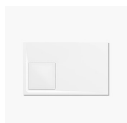
PIATTO DOCCIA ALIAS