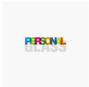
ACCESSOIRES PERSONAL GLASS