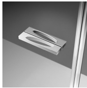
DEURKNOPPEN EN HANDGREPEN M6T STANDARD