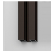
GEANODISEERDE PROFIELEN 38 - MOKA