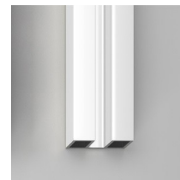
GEVERNISTE PROFIELEN 14 - WIT