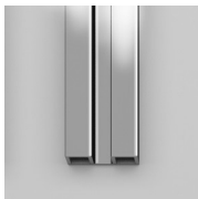
GEANODISEERDE PROFIELEN 21 - GEPOLIJST ZILVER