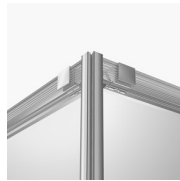
ACCESSOIRES GEPRINTE STREEP