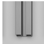
GEANODISEERDE PROFIELEN 61 - AFWERKING GEBORSTELD STAAL