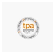
ANTI-KALKBEHANDELING VOOR PREVENTIEVE KALKWERENDE BEHANDELING (TPA)