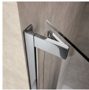
SCHARNIEREN FLR - FLARE STANDARD