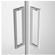
DEURKNOPPEN EN HANDGREPEN M11F STANDARD