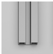
GEANODISEERDE PROFIELEN 31 - GESATINEERD ZILVER