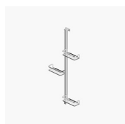
UITGERUSTE KOLOM BASKET